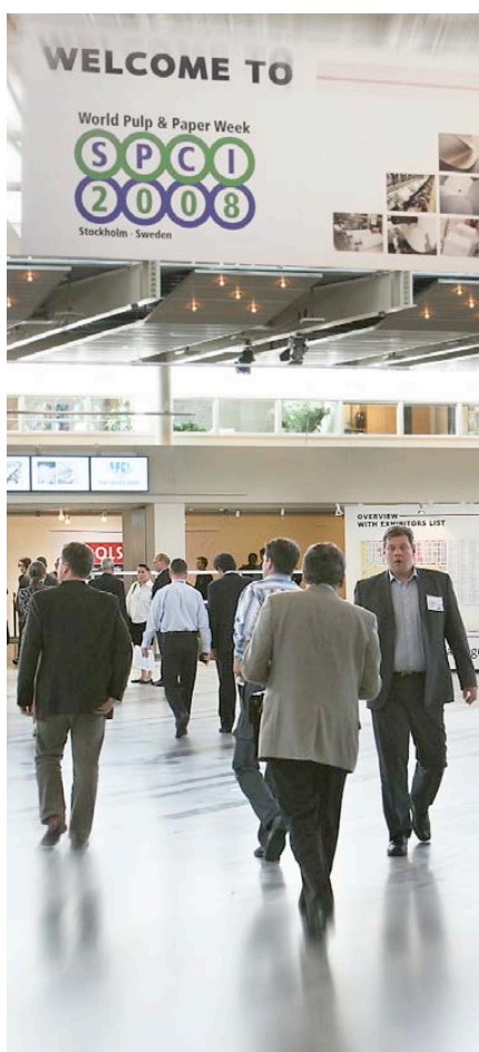
Från förra SPCI-mässan, 2008.

Årets mässa är alltså den första på 30 år där Cerlic inte ställer ut i egen regi. Deltagandet blir ändå aktivt genom att vi finns med både med produkter och personal. □