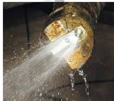
Die automatische Spülvorrichtung hat keine beweglichen Teile und stellt minimale Wartung dar und erhöht somit die Zuverlässigkeit. Die Spüldüse kann mit Wasser oder Druckluft verwendet werden.